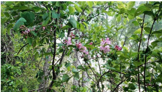
m DSC_2974 タニウツギ開花 R05.05.12AM0554 S.jpg