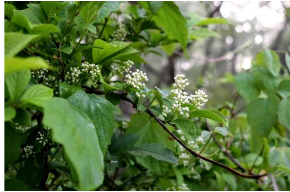
m DSC_3460 サワフタギ蕾 R05.05.12AM0553 S.jpg