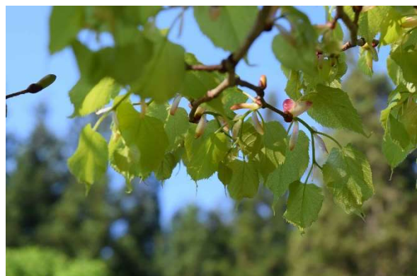
m DSC_3480 シナノキの展葉 R05.05.12AM0638 S.jpg