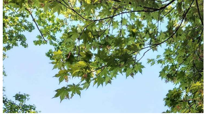
m DSC_3004 コハウチワカエデ開花 R05.05.12AM0718 S.jpg