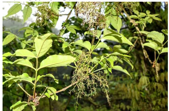
m DSC_3449 ヤチダモ花実 R05.05.12AM0539 N.jpg