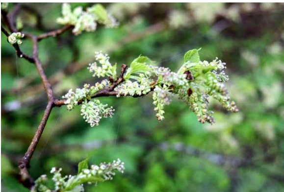
m DSC_3443 ヤマグワの花芽 R05.05.12AM0534 N.jpg