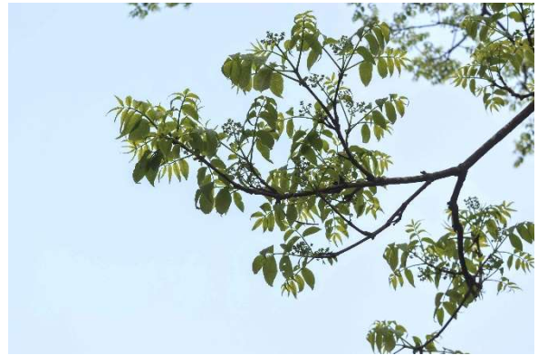
m DSC_3444 キハダ花芽 R05.05.12AM0536 N.jpg