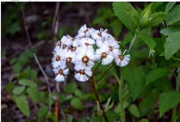
m DSC_3447 フキノトウの綿毛状種子 R054.05.12AM0538 N.jpg