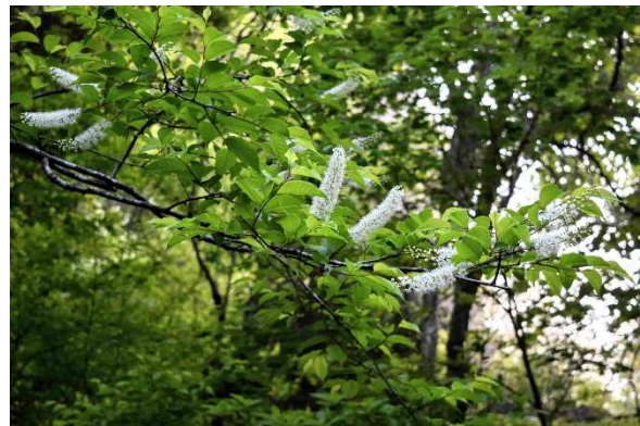
m DSC_3465 ウワミズザクラ満開 樹名板 R05.05.12AM0559 N.jpg