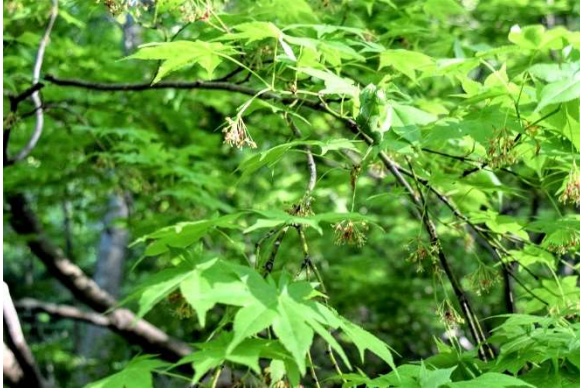
m DSC_3505 ヤマモミジ開花 R05.05.12AM0716 N.jpg