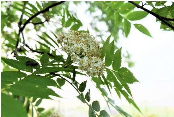
m DSC_3457 ナナカマド開花 R05.05.12AM0552 N.jpg